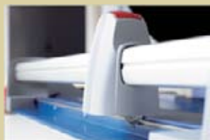
Rundmesser im Kunststoffkopf