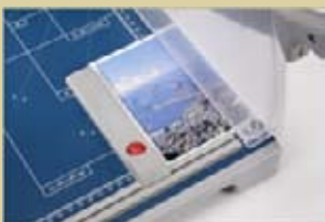
2 Winkelanlagen für exaktes Anlegen des Schnittgutes.