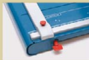
Pression connectable et déconnectable