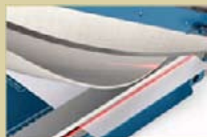
Repérage exact de la ligne de coupe par faisceau laser