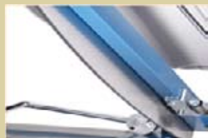
Werkstoffmesser mit Spezialanschiff.